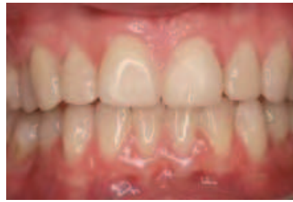
Abbildung 14: Semipermanente Repositions-Veneers aus Kunststoff im Bereich der Ober- und der Unterkieferfront (Seitenzähne sind zeitgleich mit definitiven Repositions-Onlays aus Keramik versorgt)

Bei diesem Verfahren werden zunächst Abformungen erstellt. Auf dieser Grundlage werden Modelle hergestellt und in therapeutischer Kieferposition montiert. Es folgt anschließend eine Modulation in Wachs (Wax-up), gefolgt von der Herstellung spezieller Formteile. Diese wurden ursprünglich vergleichsweise tief bis zum Zervikalsaum gezogen. Jüngere Berichte aus der diesbezüglich führenden Züricher Arbeitsgruppe um Attin empfehlen nunmehr, stattdessen die Formteile im Kauflächenbereich aus Silikon herzustellen, das anschließend durch Kunststoff überdeckt wird. Die Formteile werden allerdings nicht ganz bis zum Zervikalsaum gezogen, so dass das später im Mund aufgebrachte Kompositmaterial bei Bedarf gut nach zervikal entweichen kann. Die Kauflächen werden bei diesem Verfahren