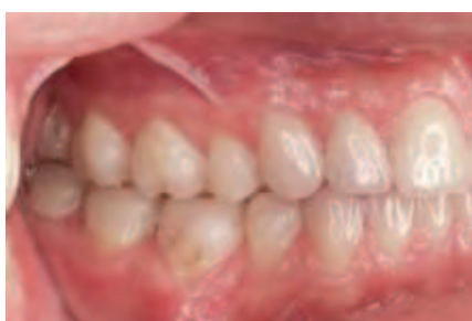
Abbildung 16: Ansicht in Repositionsposition von lateral rechts