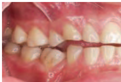
Abbildung 2: Ansicht in habitueller Okklusion von lateral rechts