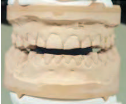
Abbildung 10: Situationsmodell aus Typ-IV-Gips in Repositionsposition