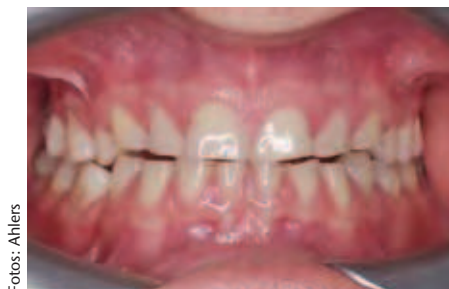
Abbildung 1: Situation nach fortgeschrittenem Zahnhartsubstanzverlust durch Bruxismus, Ansicht in habitueller Okklusion von frontal