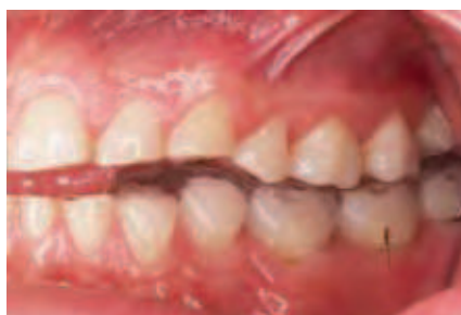
Abbildung 9: Ansicht in Repositionsposition von lateral links

vorher auf die jeweilige Zahnhartsubstanz einwirkenden Kraft unverhältnismäßige Substanzdefekte auftreten – etwa durch