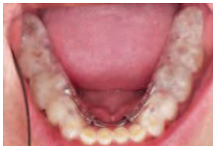
Abbildung 6: Unterkiefer mit Repositionsschiene (Inzisiven unbedeckt für ganztätiges Tragen mit akzeptabler Phonetik; die Zahnstellung blieb kontrolliert unverändert)

1. Behandlung von Folgeschäden nach Bruxismus: In diesen Fällen haben Patienten durch massiven Bruxismus umfangreiche Zahnhartsubstanzschäden im Sinne einer Selbstdestruktion erlitten. Diese können in erheblichem Maße die Kaufunktion beeinträchtigen. Je nach Verteilung der Substanzdefekte kommen auch Einschränkungen in der Phonetik hinzu. Zudem beobachten betroffene Patienten ab einem bestimmten Zeitpunkt, dass in erheblichem Maße scheinbar plötzliche und im Verhältnis zur