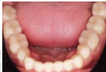
Abbildung 19: Aufsicht auf den Unterkiefer

aufrauung der Oberfläche erreichen. Typischerweise wird dies durch entsprechende Sandstrahlverfahren erreicht, wenn man davon ausgeht, dass eine Ätzung keramischer Oberflächen im Mund mittels Flusssäure aus Sicherheitsgründen nicht erfolgen soll. Da zusätzlich eine Silanisierung der Oberflächen erforderlich ist, bietet sich an, den Sandstrahleffekt mit der Silanisierung zu verbinden. Entsprechende Systeme sind eingeführt (Cojet, Firma 3M ESPE, Seefeld). Zusätzlich sind mittlerweile Silanhaftvermittler verfügbar, die auf verschiedenen keramischen Oberflächen einsetzbar sind (beispielsweise Monobond Plus, Firma Ivoclar Vivadent).