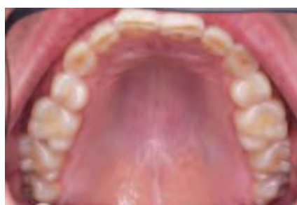
Abbildung 4: Aufsicht auf den Oberkiefer

Dem zugrunde lag einerseits die empirische Erfahrung vieler Zahnärzte, dass Funktionsstörungen des Kauorgans vielfach erst nach vorangegangenen zahnärztlichen Maßnahmen entstanden. Dies führte zu dem (korrekten) Rückschluss, dass craniomandibuläre Dysfunktionen offensichtlich durch zahnärztliche Intervention ausgelöst wurden. Dies wiederum bildete die Grundlage für die Annahme, dass durch eine erneute Revisionsintervention die craniomandibuläre