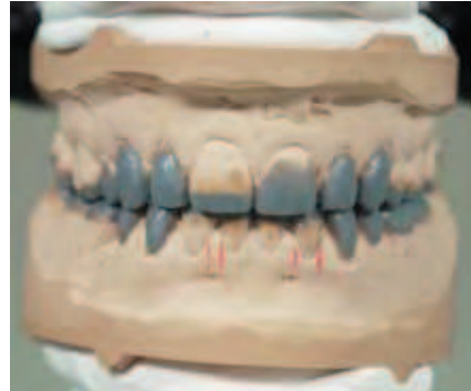
Abbildung 11: Wax-Up der Repositions-Onlays und Repositions-Veneers, Ansicht von frontal