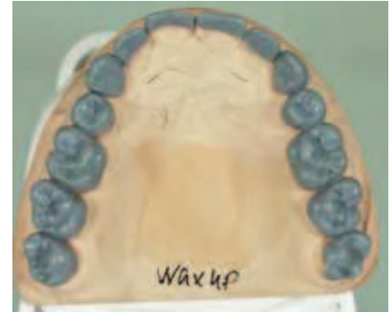
Abbildung 12: Aufsicht auf den Oberkiefer

Regel nach Erfahrung der Autoren nicht dauerhaft, sofern entweder die zuvor erosiv wirkende Noxe weiter wirkt und/oder die bruxistische Aktivität fortbesteht. In diesen Fällen stellt sich daher eher früher als später die Frage nach der Restauration der Zähne, und zwar zu deren Substanzerhalt sowie zur dauerhaften Schmerzbesetzung und schließlich zur Wiederherstellung der früheren Kaufunktion sowie – sofern erforderlich – der Phonetik und der Ästhetik.