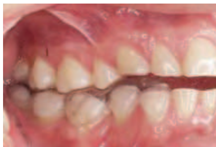
Abbildung 8: Ansicht in Repositionsposition von lateral rechts