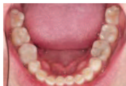
Abbildung 5: Aufsicht auf den Unterkiefer

Dysfunktion auch wieder zu beseitigen sei. Tatsächlich existieren Arbeiten, die zeigen, dass Maßnahmen zur Verbesserung der okklusalen Harmonie eine langfristige Reduktion kaufunktioneller Risiken der betreffenden Patienten bewirken [Forssell et al., 1986; Forssell et al., 1987; Kirveskari et al., 1989; Kirveskari et al., 1989; Kirveskari et al., 1998].