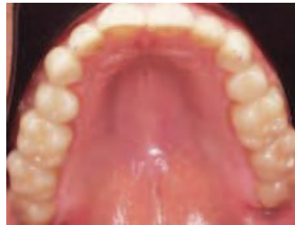
Abbildung 18: Aufsicht auf den Oberkiefer

■ Kleben auf Keramik: Bei Oberflächen aus Keramik ist eine Vorbehandlung der Keramik erforderlich. Diese sollte eine Mikro-