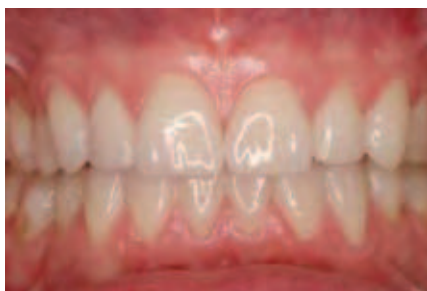
Abbildung 15: Frontzähne mit definitiven erweiterten („partial wrap“) Veneers und Seitenzähne mit definitiven Repositions-Onlays aus Lithiumdisilikatkeramik