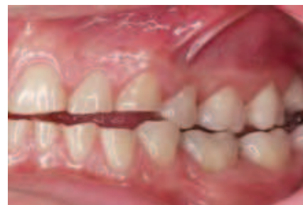
Abbildung 3: Ansicht in habitueller Okklusion von lateral links

In der Behandlung craniomandibulärer Dysfunktionen hat es im Laufe der vergangenen Jahre und Jahrzehnte verschiedene Paradigmenwechsel gegeben. Der erste besteht in der Ausrichtung der Funktionstherapie an sich. In der Vergangenheit war hier der scheinbar selbstverständliche Grundkonsens innerhalb der Zahnmedizin, dass nach jeder funktionstherapeutischen Vorbehandlung eine restaurative Folgebehandlung stattfinden müsse.