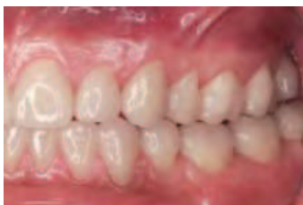
Abbildung 17: Ansicht in Repositionsposition von lateral links

im Seitenzahnbereich möglich ist. Zudem ist das Abrasionsverhalten vergleichsweise schmelzähnlich, so dass mit der Verfügbarkeit dieser Keramiken die Voraussetzung geschaffen schien, entsprechende Restaurationen aus Keramik anzufertigen. Einschränkend ist in diesem Zusammenhang festzuhalten, dass bislang vonseiten des Keramik-Herstellers eine ausdrückliche „Kontraindikation“ für Lithiumdisilikatkeramik in der Anwendung bei „Bruxismus“ ausgesprochen wird [Ivoclar Vivadent, 2009]. Dagegen steht allerdings, dass durch den Hersteller Veranstaltungen organisiert