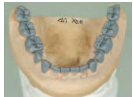
Abbildung 13: Aufsicht auf den Unterkiefer

In der Vergangenheit wurden derartige Behandlungen typischerweise auf der Basis restaurativer Behandlungstechniken durchgeführt. Hierfür wurden zunächst die betreffenden Zähne präpariert, gefolgt von einer Kieferrelationsbestimmung in zentrischer oder (vermeintlich) therapeutischer Kieferposition. Daran schloss sich die Anfertigung chairside hergestellter Provisorien an. Nach einem unvermeidbaren Intervall zur Herstellung von Laborprovisorien wurden dann Langzeitprovisorien eingegliedert. Deren Aufgabe war es, die Akzeptanz der jeweiligen Kieferposition und die Stabilisierung der