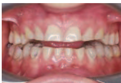
Abbildung 7: Unterkiefer in Repositionsposition, Ansicht von frontal